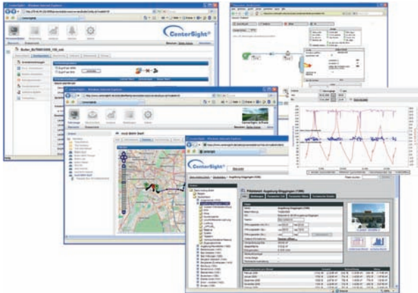
CenterSight®: Online-Zugriff auf alle Funktionen per Webbrowser