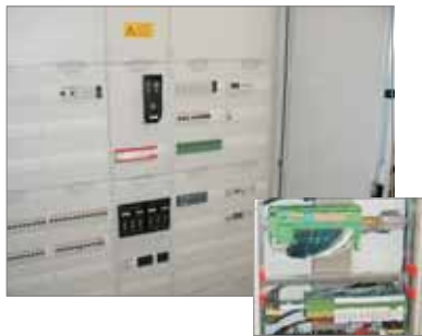
Integrierte Elektroverteilung mit Automatisierung aus einer Hand