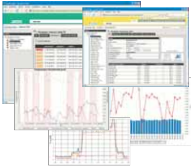
ShopInsight: Alle Funktionen auf einen Blick.